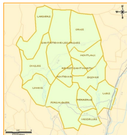
Les communes membres De la communauté de communes