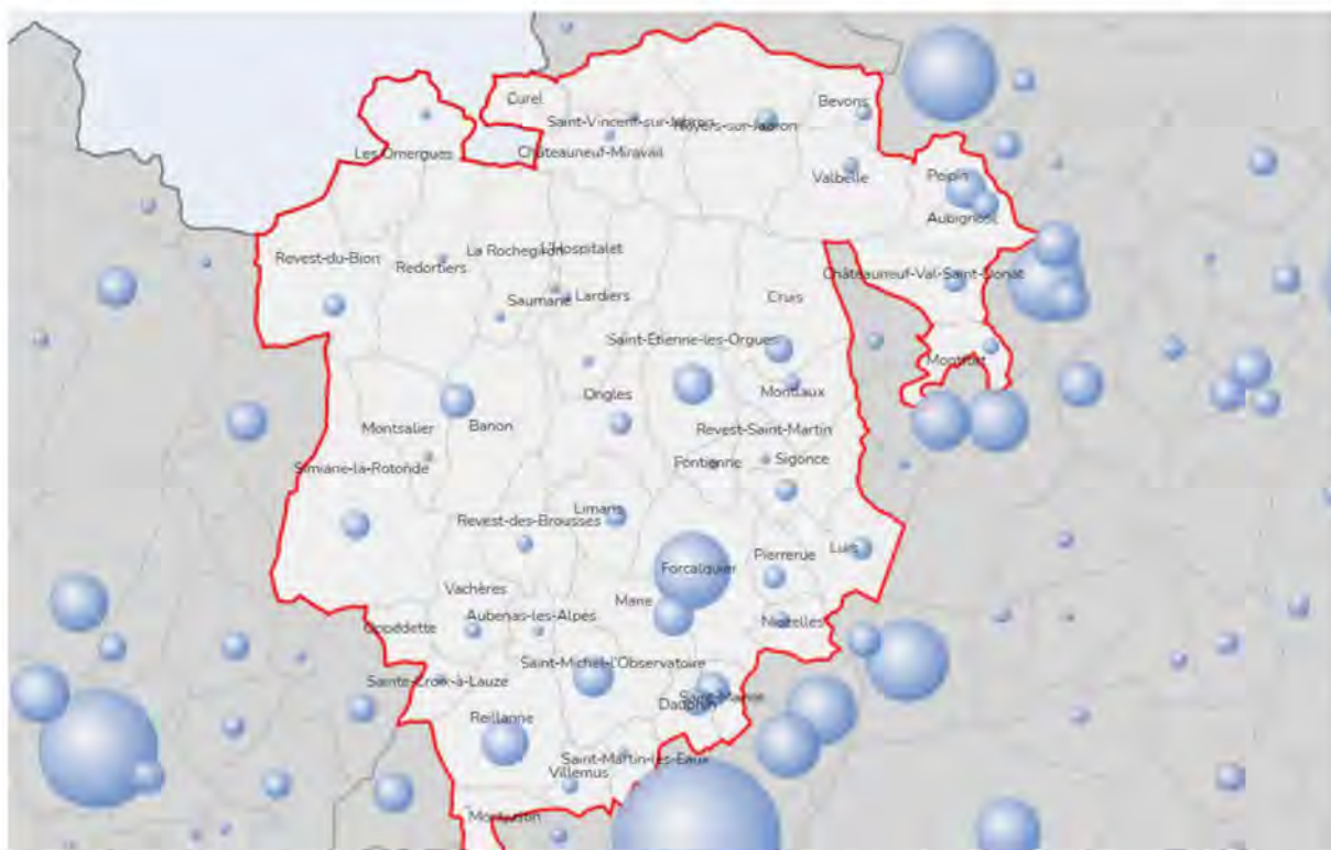
Périmètre du territoire « Haute Provence Durance » du contrat Nos Territoires d'Abord

Accusé de réception en préfecture 004-240400440-20230217-03-2023-DE Date de réception préfecture : 22/02/2023